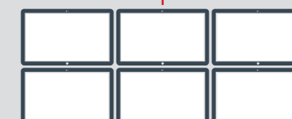
Central receptora de alarmas